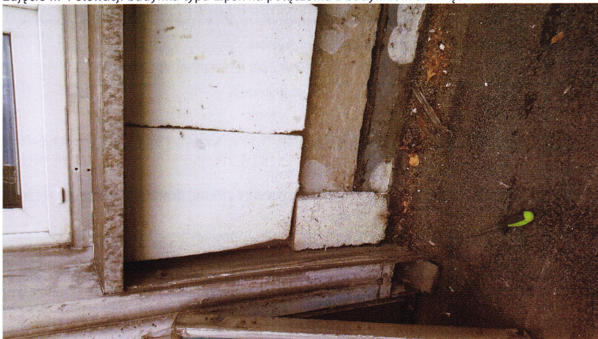
Zdjęcie nr 1 elewacji budynku typu Lipsk na połączeniu z budynkiem tzw. łącznikiem