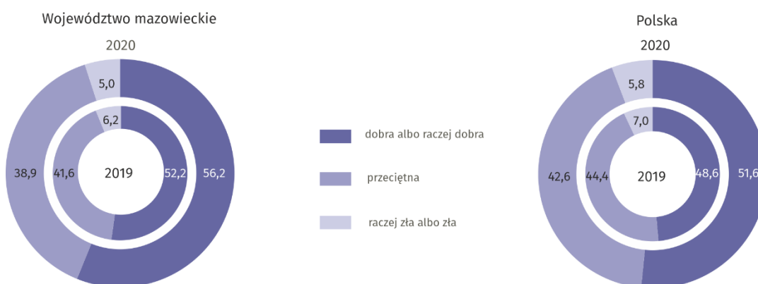
Wykres 3. Subiektywna ocena sytuacji materialnej gospodarstw domowych (w %)

W skali roku odnotowano wzrost odsetka gospodarstw domowych oceniających swoją sytuację jako dobrą albo raczej dobrą