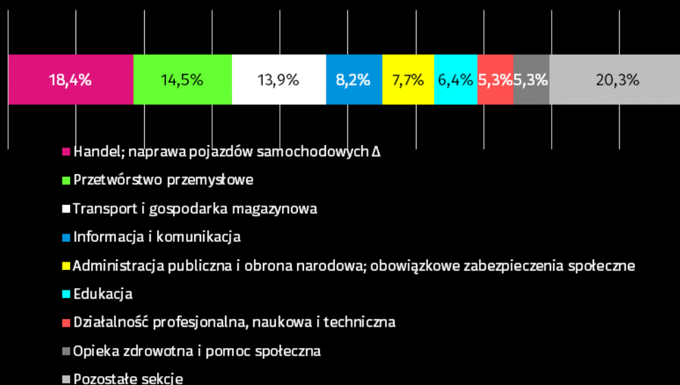
Wykres 2. Wolne miejsca pracy według sekcji PKD na koniec 2025 r.

Na koniec roku najwięcej wolnych miejsc pracy pozostawało w handlu; naprawie pojazdów samochodowych