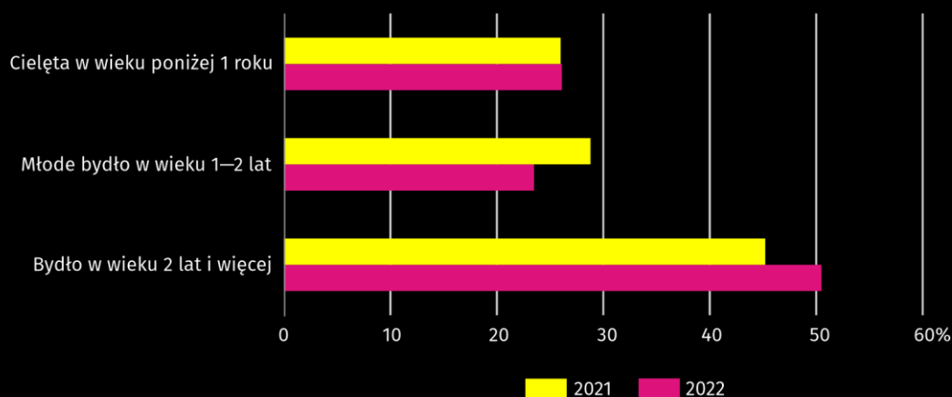
Wykres 2. Struktura pogłowia bydła według grup wiekowo-użytkowych Stan w grudniu

Pogłowie owiec w grudniu 2022 r. wyniosło 10,4 tys. sztuk i zwiększyło się w porównaniu ze stanem notowanym przed rokiem o 51 sztuk, tj. o 0,5%. Liczba maciorek zwiększyła się o 45,7%.