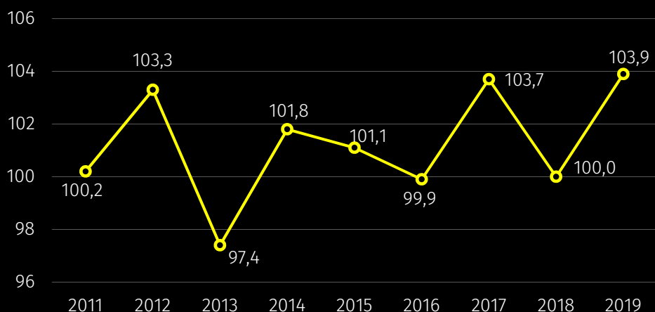
Wykres 2. Dynamika przeciętnych miesięcznych wydatków na 1 osobę w gospodarstwach domowych (rok poprzedni=100)

W stosunku do 2018 r. zwiększyły się np. wydatki na łączność (o 25,6%), edukację (o 12,9%), zdrowie (o 11,3%), użytkowanie mieszkania i nośniki energii (o 9,1%), żywność i napoje bezalkoholowe (o 6,4%). W ujęciu rocznym spadek odnotowano wśród wydatków m.in. na transport (o 12,3%), rekreację i kulturę (o 2,8%).