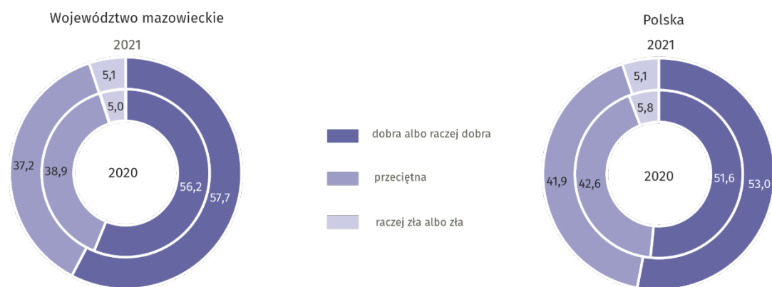
Tablica 2. Przeciętne miesięczne wydatki na 1 osobę w gospodarstwach domowych