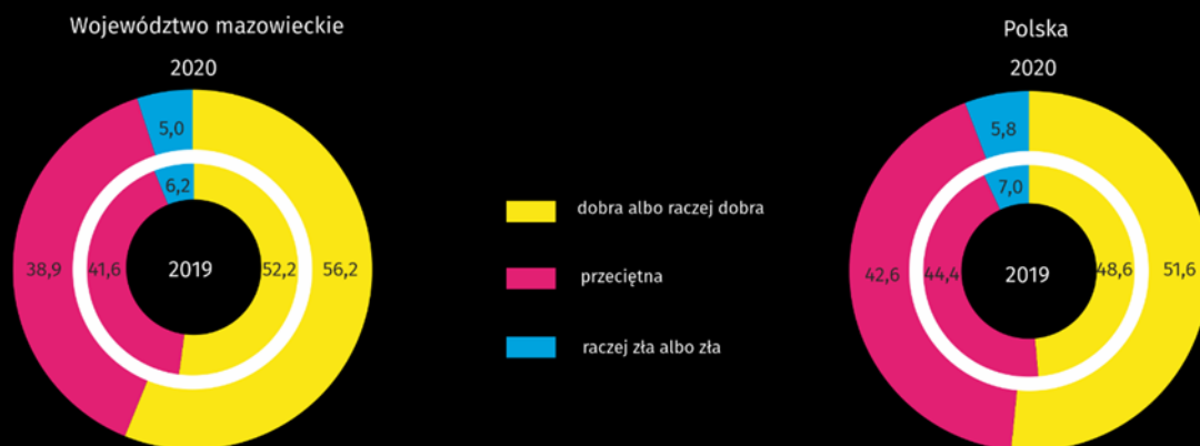
Wykres 3. Subiektywna ocena sytuacji materialnej gospodarstw domowych (w %)

W skali roku odnotowano wzrost odsetka gospodarstw domowych oceniających swoją sytuację jako dobrą albo raczej dobrą