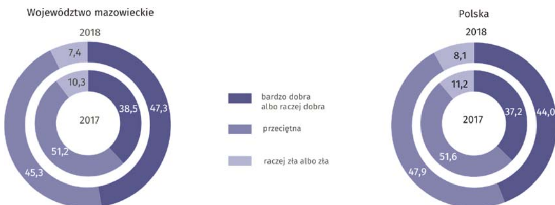
Wykres 3. Subiektywna ocena sytuacji materialnej gospodarstw domowych (w %)

W skali roku odnotowano wzrost odsetka gospodarstw domowych oceniających swoją sytuację jako bardzo dobrą albo raczej dobrą