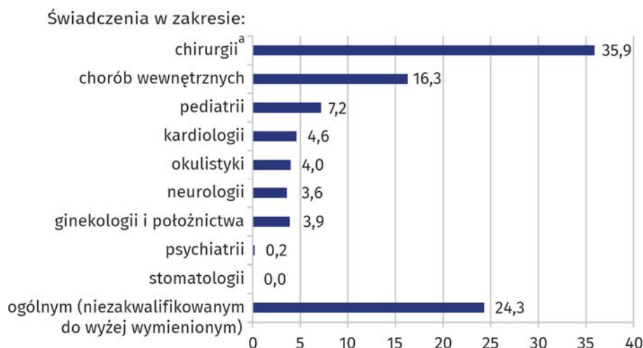
Wykres 3. Struktura udzielonych świadczeń zdrowotnych w izbie przyjęć lub szpitalnym oddziale ratunkowym w trybie ambulatoryjnym w 2020 r.

Co piąty pacjent leczony ambulatoryjnie korzystał ze świadczeń chirurgii urazowo-ortopedycznej