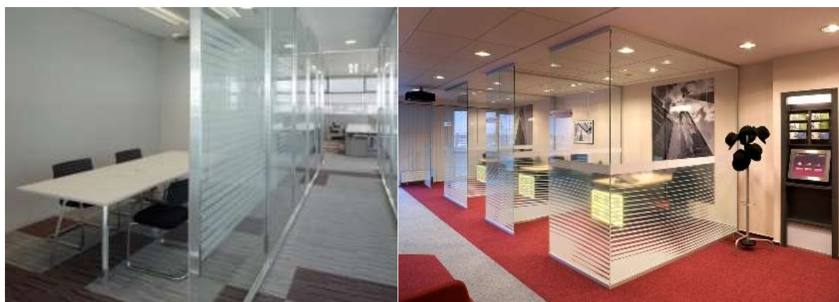
Przykład grafiki na przeszkleniach

Strefa REGON oddzielona szklaną ścianą wys. 226 cm (szyby wyklejone mleczną folią do wysokości 120 cm) od strefy INFORMATORIUM , z pomieszczeniami wydzielonymi również szklaną ścianą o wysokości 226 cm (szyby wyklejone mleczną folią do wysokości 120 cm)