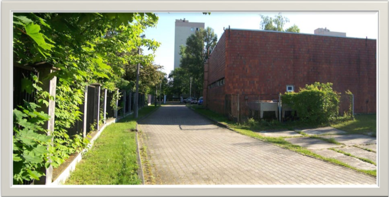
Zdjęcie 14: Widok wzdłuż ulicy Ustrzyckiej (w głębi brama p.poż)