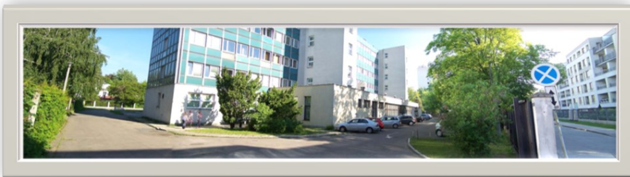
Zdjęcie 10: Widok od strony wyjazdu na ulicę Solińską (z prawej strony ulica Solińska, lewa strona widok wzdłuż ulicy Leżajskiej)