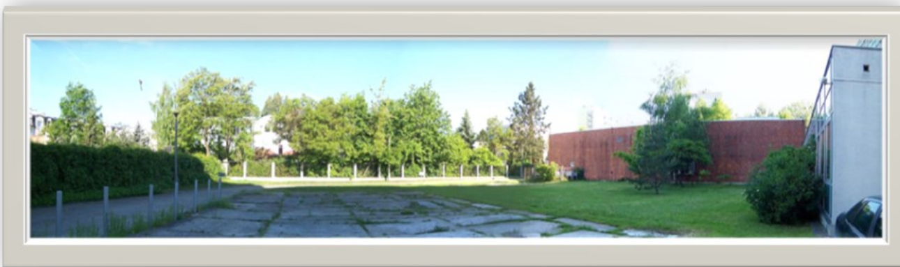
Zdjęcie 11: Widok wzdłuż ulicy Leżajskiej