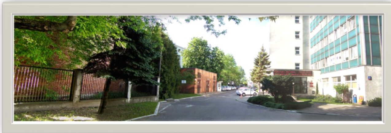
Zdjęcie 3: Widok od strony ulicy 1 Sierpnia 21 w kierunku wyjazdu na ulicę Solińską