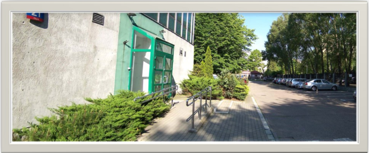
Zdjęcie 6: Widok wzdłuż ulicy 1 Sierpnia (w kierunku bramy p.poż.)