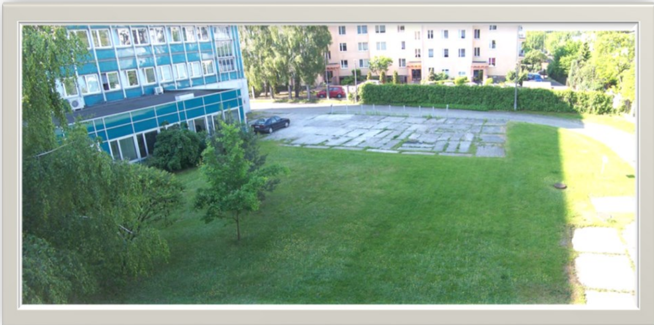
Zdjęcie 13: Widok z góry na teren ze zdjęcia nr 12