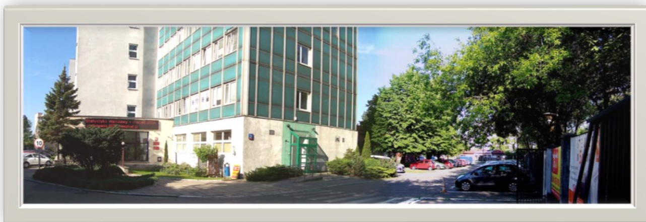
Zdjęcie 4: Widok od wjazdu na wejście główne i wzdłuż ulicy 1 Sierpnia (w kierunku bramy p.poż)