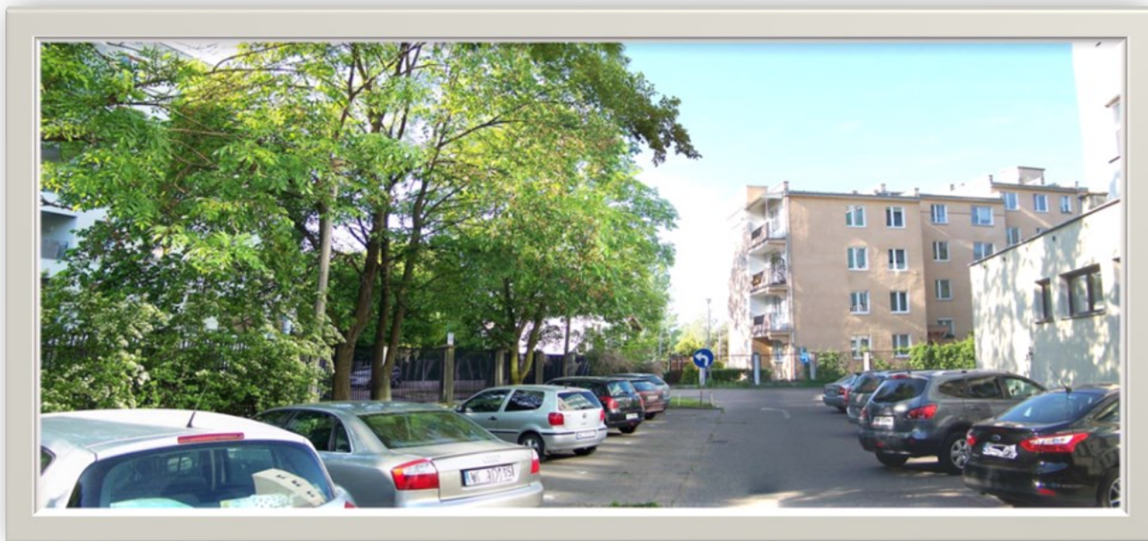
Zdjęcie 9: Widok wzdłuż ulicy Solińskiej (w głębi wyjazd z posesji, z prawej budynki Urzędu)