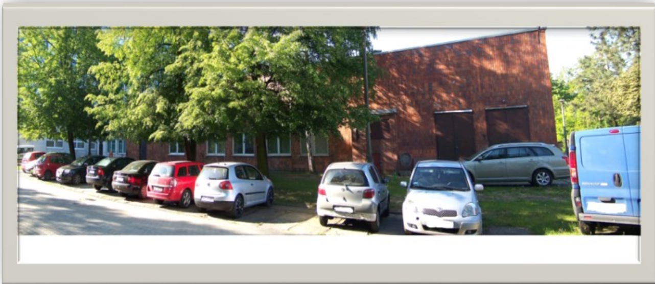
Zdjęcie 15: Widok od strony bramy p.poż. (ulica 1 Sierpnia)