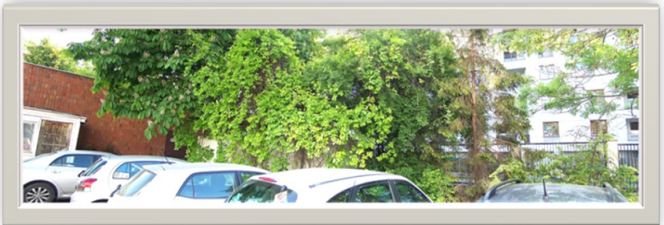
Zdjęcie 8: Widok na ulicę Solińską od strony budynków Urzędu