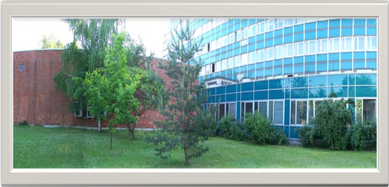
Zdjęcie 12: Widok od strony ulicy Leżajskiej