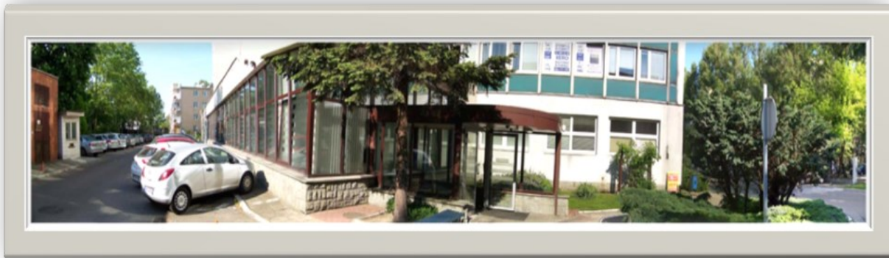
Zdjęcie 2: Widok od strony wjazdu z ulicy 1 Sierpnia na wejście do budynku Urzędu (z lewej strony widok wzdłuż ulicy Solińskiej, z prawej widok wzdłuż ulicy 1 Sierpnia)