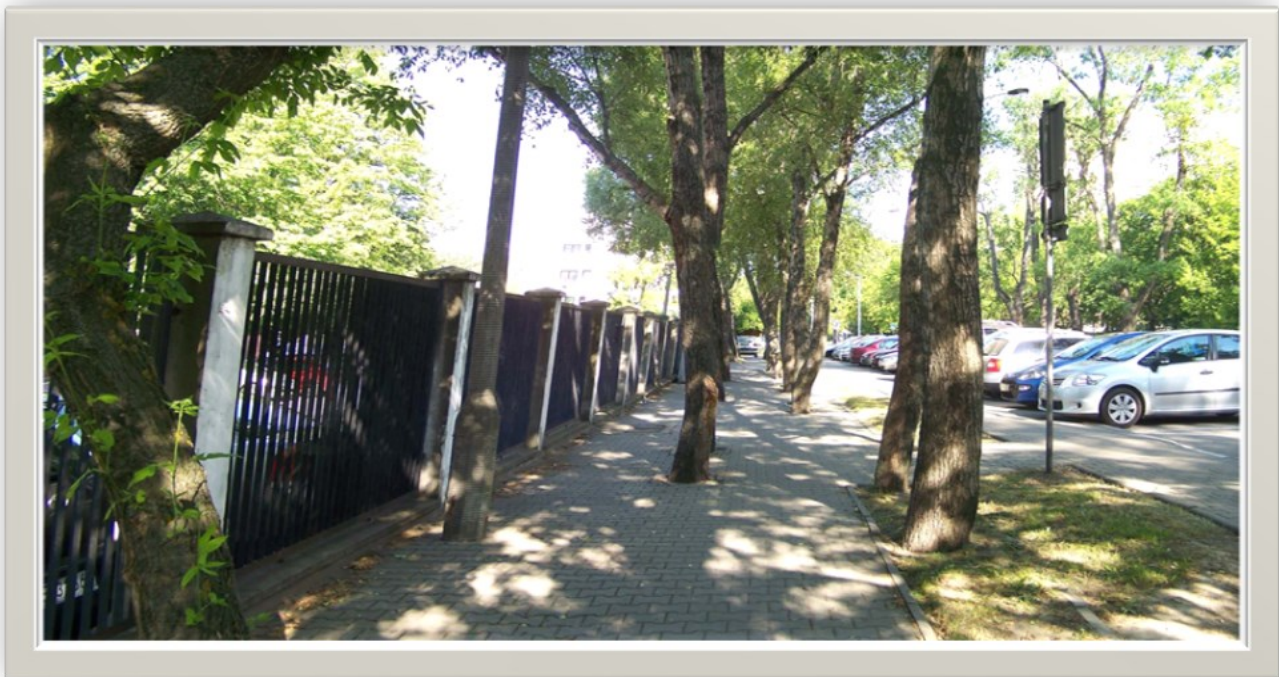
Zdjęcie 1: Widok ulicy 1 Sierpnia - wjazd na posesję