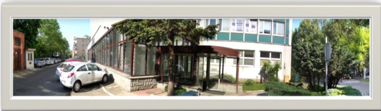
Zdjęcie 2: Widok od strony wjazdu z ulicy 1 Sierpnia na wejście do budynku Urzędu (z lewej strony widok wzdłuż ulicy Solińskiej, z prawej widok wzdłuż ulicy 1 Sierpnia)