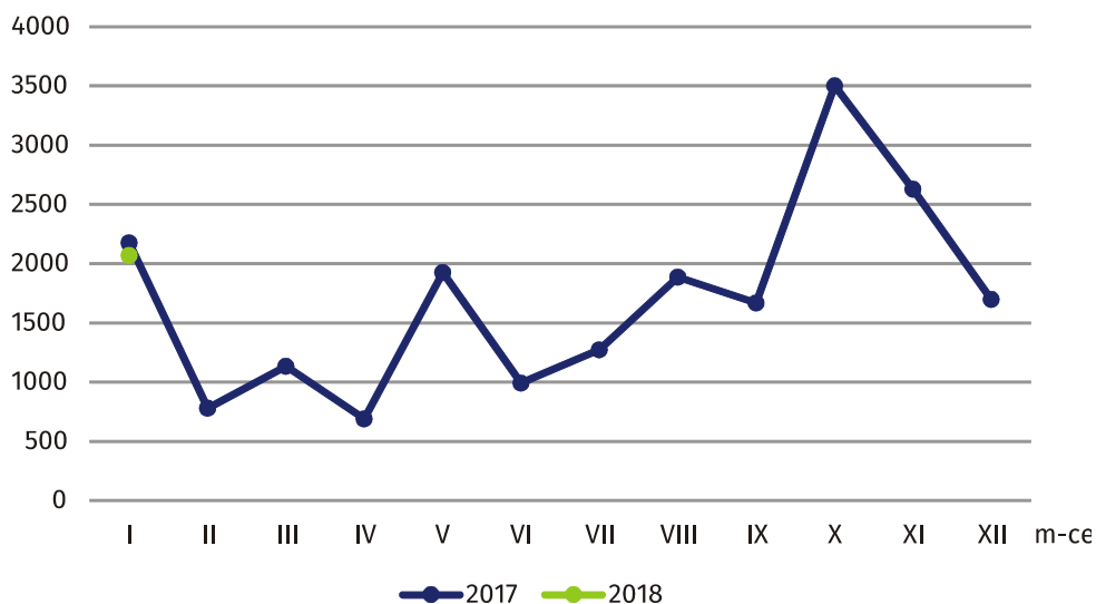
Wykres 4. Mieszkania oddane do użytkowania

W styczniu 2018 r. rozpoczęto budowę 1759 mieszkań (o 63,0% więcej niż w analogicznym okresie 2017 r.), z czego: 1744 w budownictwie realizowanym na sprzedaż lub wynajem, 15 w budownictwie indywidualnym.